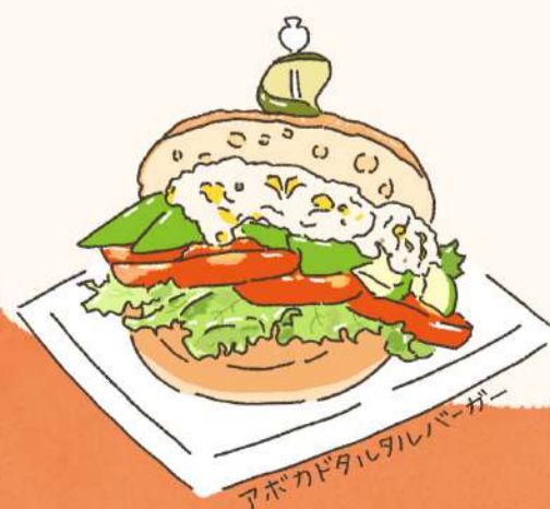
アボカドタルタルバーガー