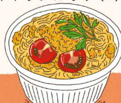
マンゴーと豚ひき肉のスパゲッティ