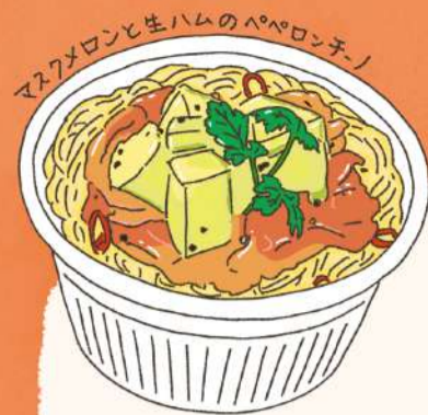
マスクメロンと生ハムのペペロンチーノ